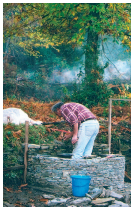
Aménagement du lieu-dit Campaghinacciu.

Le printemps 2007 devrait voir la fin de ce chantier complété par l'installation d'une table et de bancs en bois (3 e et dernière phase) afin de créer une véritable aire de pique-nique aménagée à proximité d'un « chjostru » véritable ouvrage patrimonial préservé par le temps qui passe... ■