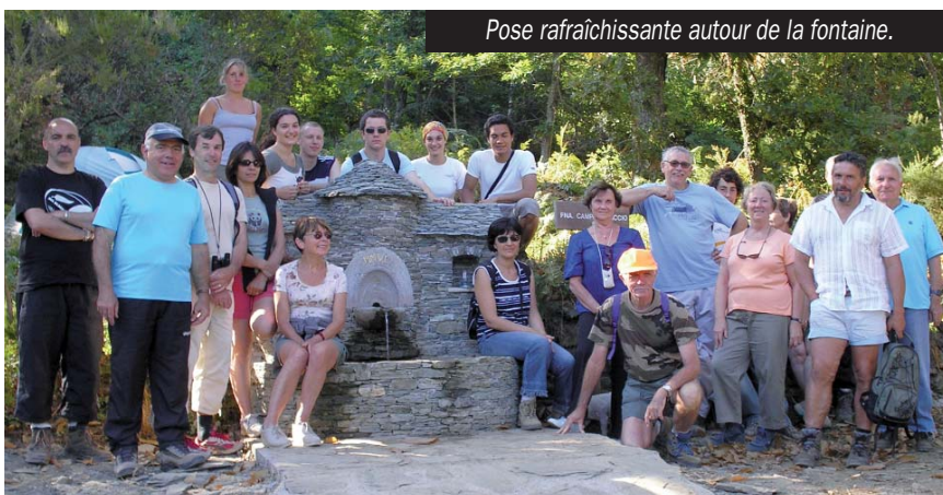
Pose rafraîchissante autour de la fontaine.

L es travaux d'aménagement du lieu-dit Campaghinacciu se sont achevés fin juillet 2007 avec le terrassement du terrain, l'enfouissement des canalisations, l'installation de la table et des bancs pour l'aire de pique-nique... Cette journée harassante a malgré tout réuni un grand nombre de bénévoles et s'est achevée autour d'un « spuntinu » très convivial. Un grand merci à nouveau à toutes les personnes qui se sont impliquées dans cette réalisation.