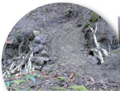
Aménagement du passage d'un talweg sur le sentier reliant l'église de Saint Hilaire aux ruines du village de Cariolu