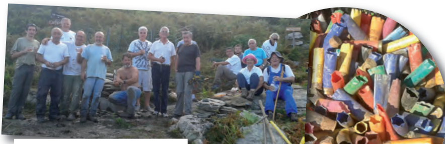
Remise en état de la fontaine de Tierraghji