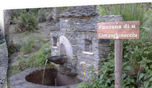
Remplacement progressif des panneaux signalétiques en lettres autocollantes par d'autres avec des lettres gravées